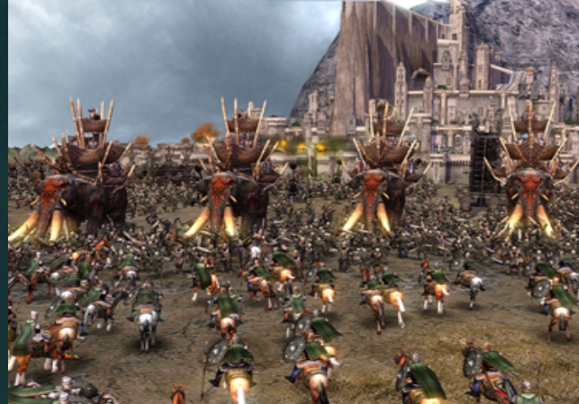
반지의 제왕: Battle for Middle Earth - EA