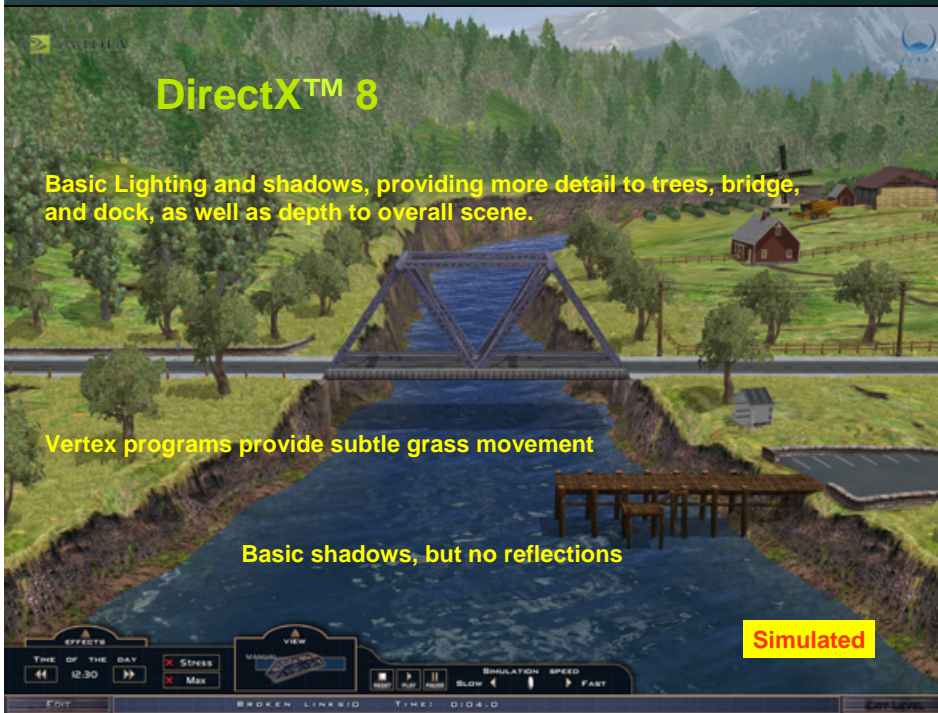
DirectX 8 Scene