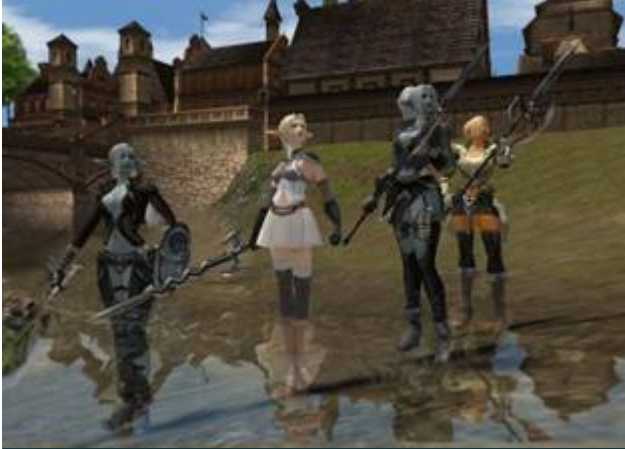
리니지 II - NCsoft