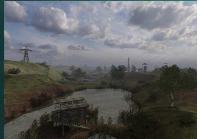
스토커 - GSC Games / THQ