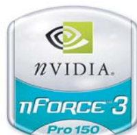
Modellsreihe NVIDIA nForce3 Pro Plakettenlogo (modellspezifisch)