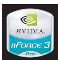
Sfondi a predominante scuro