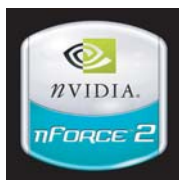
Fonds de couleur sombre Modèle série