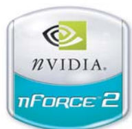
Fonds de couleur claire

Le logo du produit nForce2 peut être présenté de plusieurs façons :