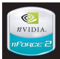
Sfondi a predominante scura